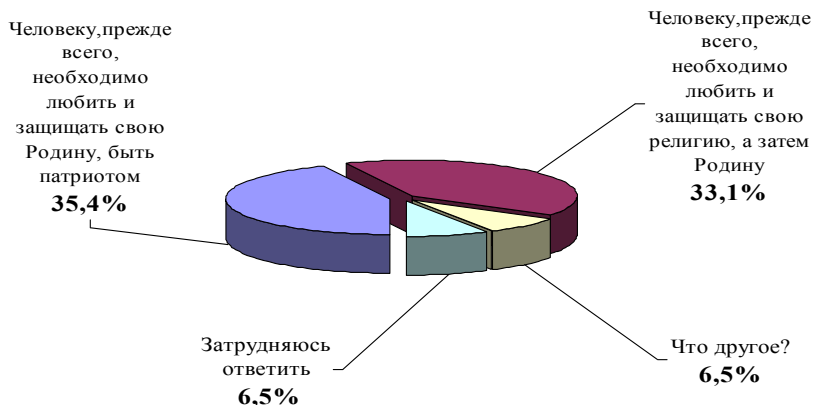
Рисунок 2. Диаграмма распределения ответов на вопрос о ценностях патриотизма и религии, РД, старшекласники общеобразовательных школ, 2019 г., N – 619

В отношении других коренных народностей Дагестана эти показатели были значительно ниже – от 5 до 8 процентов. На наш взгляд, отношение к русскому человеку можно считать индикатором российского патриотизма. И совершенно очевидно, что исламская религиозность в Дагестане снижает показатели такого патриотизма.