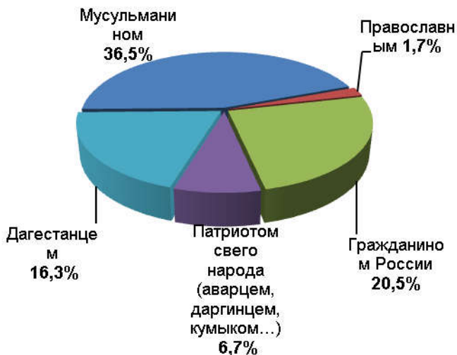
Рисунок 3. Диаграмма распределения ответов на вопрос "Кем Вы себя прежде всего считаете?", РД, старшеклассники общеобразовательных школ, 2019 г., N □ 619

Только 22,7 % молодых учителей считает, что выпускник школы "должен быть патриотом России". У старшего поколения этот показатель оказался равным 38,9 %. По сути, дагестанская общеобразовательная школа в лице её педагогических кадров не готова к воспитанию патриотов России.