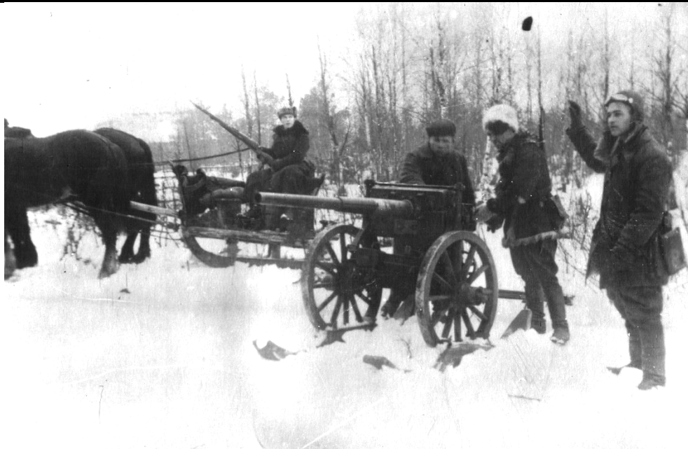
Артиллерийский расчёт. Пинское партизанское соединение (1943 г.)